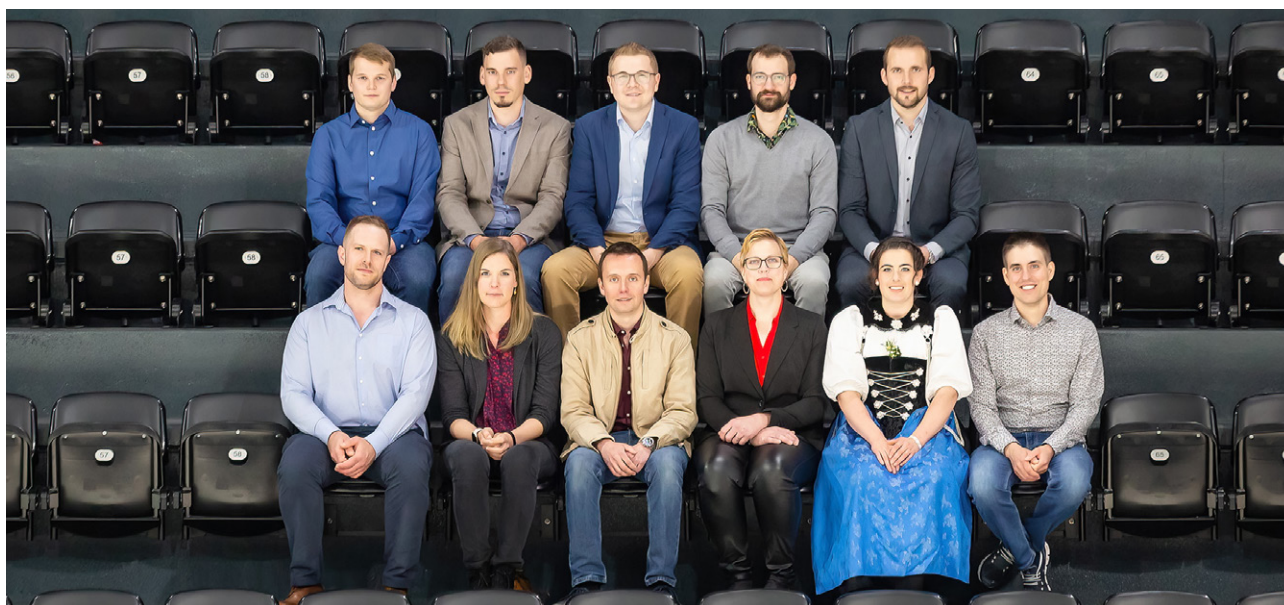
Die Diplomanden der Berufsprüfung und der höheren Fachprüfung anlässlich der Diplomfeier vom 6. Mai 2022.